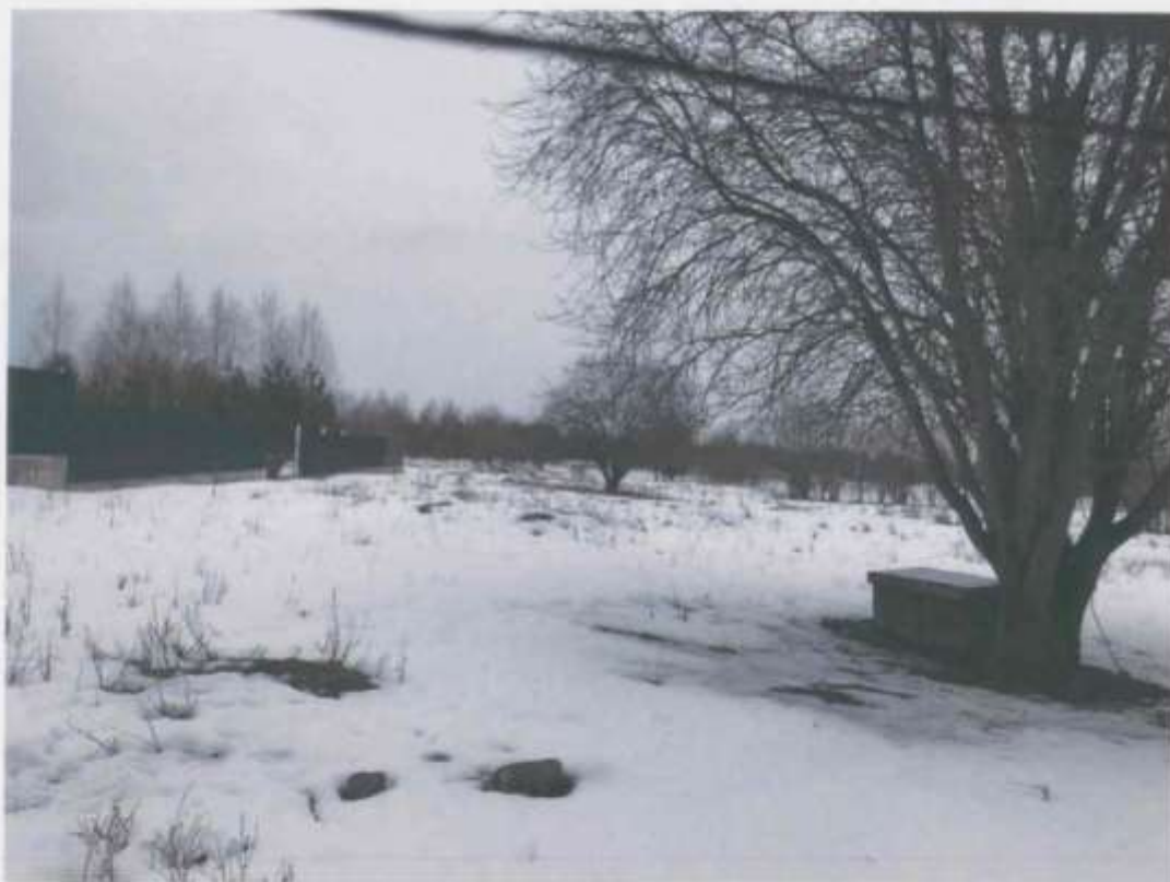
ФОТО № 1

143800 Московская область, рп. Лотошино, д. Матвейково, Российская Федерация, городской округ Лотошино (адрес земельного участка)