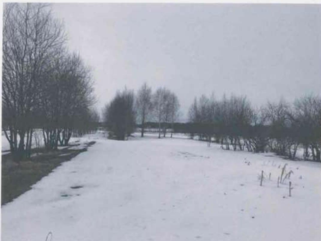
ФОТО № 1

Российская Федерация, Московская область, городской округ Лотошино, рп. Лотошино, д. Астренево (адрес земельного участка)